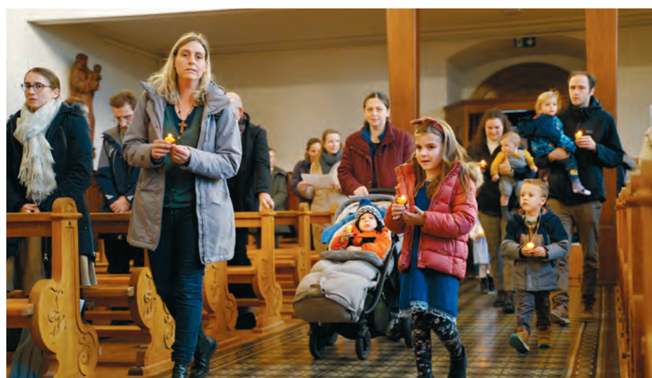
Eindrücke vom ANASTASIS-Gmeinschaftssunntig in Zug.

doch kommen alle, Kinder und Erwachsene, wieder zusammen für einen gemeinsamen Abschluss. Ein Lied, ein Gebet, ein Segen.