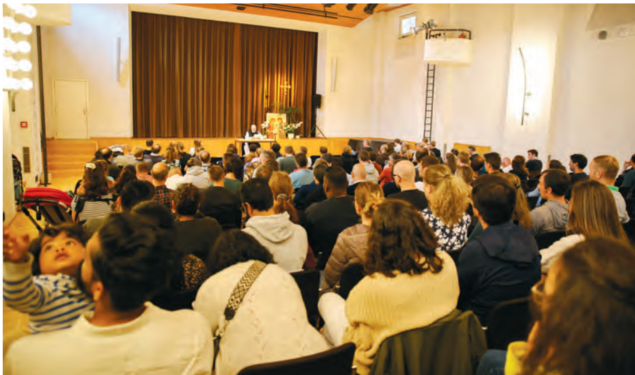
Impression vom Vortrag für die Eltern am Weltfamilientreffen 2025 in Einsiedeln.