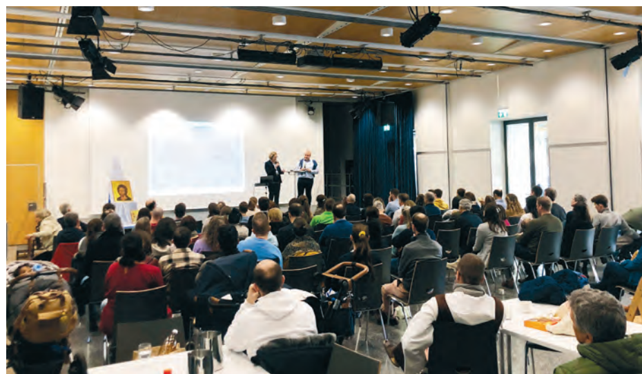
Am ANASTASIS-Nachmittag gibt es jeweils einen Vortrag für die Erwachsenen.

Die nächsten ANASTASIS-Sonntage: 28. Juni 2026, 13. September 2026, 8. November 2026, 13. Dezember 2026 seligpreisungen.ch