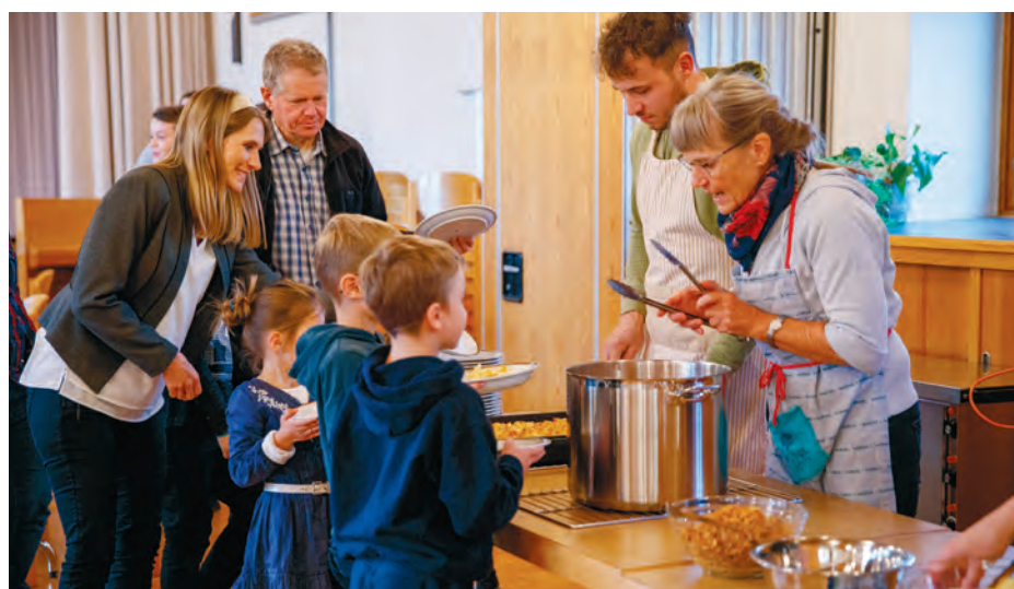
Eindrücke von einem Familiensontag in Jonschwil SG.

Aufgrund der Platzbeschränkung während der Coronazeit war es für Familien schwierig, rechtzeitig zum Gottesdienst zu kommen. So fanden alle 14 Tage spezielle Familiengottesdienste statt. Nach der Pandemie ist der Wunsch nach diesen Gottesdiensten geblieben. So wurden fünf Gottesdienste pro Jahr mit dem zusätzlichen Programm zu Familiensontagen ergänzt. Wir freuen uns an den teilnehmenden und an der Zahl wachsenden Familien.