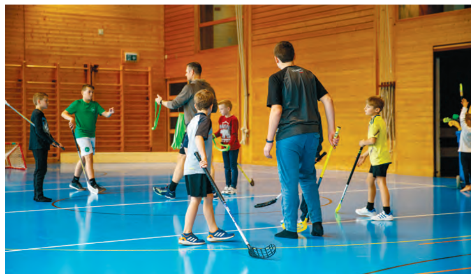
Für die Kinder steht jeweils auch eine Turnhalle zur Verfügung.

Die nächsten Familiensontage: 7. Juni 2026, 13. September 2026, 8. November 2026 fnhg.ch